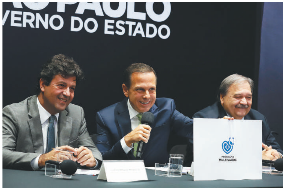
Governo de São Paulo

ter seu atendimento concluído na própria UBS, receber o encaminhamento para avaliação presencial com um dermatologista em serviço de referência da região ou, ainda, encaminhado para a realização de biópsia nos casos que indicarem suspeita de câncer. O laudo fica pronto em sete dias úteis.