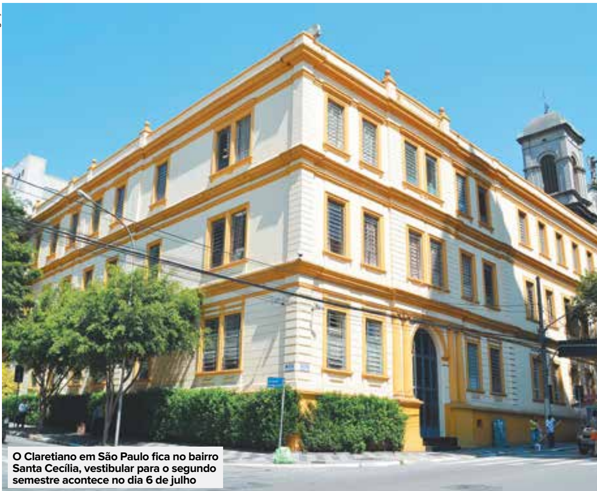
O Claretiano em São Paulo fica no bairro Santa Cecília, vestibular para o segundo semestre acontece no dia 6 de julho

tem Polo de Apoio Presencial em São Paulo, oferece mais de 30 opções de cursos na cidade. Eles abrangem as mais variadas áreas do conhecimento, por exemplo, Educação, Direito, Teologia, Filosofia, Cursos Superiores de Tecnologia, Saúde e Gestão.