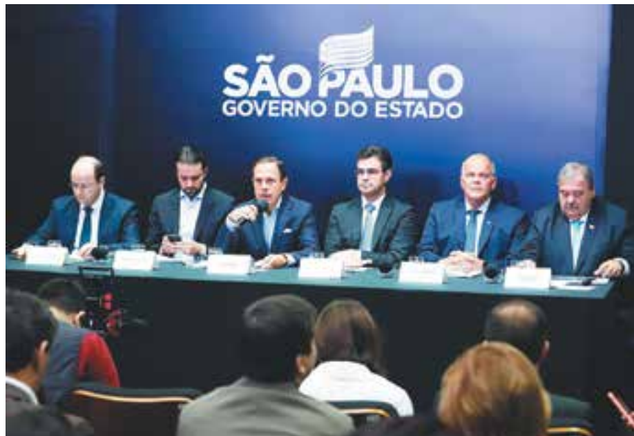
Governo de São Paulo

Os exames serão realizados em horários alternativos, por meio de parceiros privados, bem como a ampliação da oferta nos serviços da rede própria estadual – hospitais e AMEs (Ambulatórios Médicos de Especialidades).